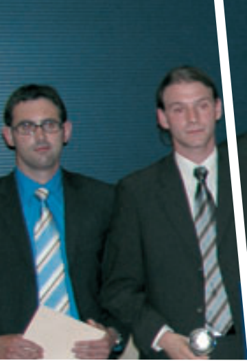
Die prämierten Absolventen