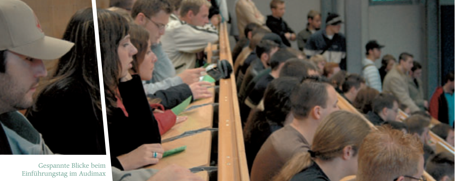
Gespannte Blicke beim Einführungstag im Audimax