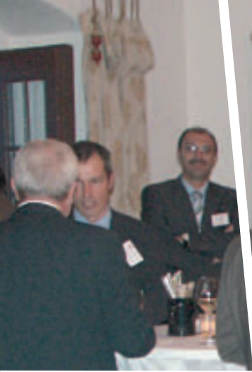
Netzwerke als Erfolgsgarantie